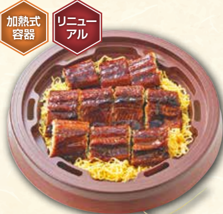
81 あったかうなぎせいろ蒸し (直径18cm) 2,400円 (税抜) 2,592円(税込) ※あたたかくなる加熱式容器を使用