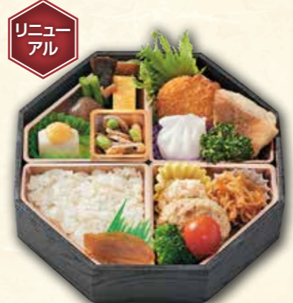
76 健康彩り弁当 (20.5×20.5cm) 1,700円 (税抜) 1,836円(税込) 糖質の気になる方へ素材を吟味しました。