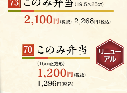
70 このみ弁当 (16cm正方形) 1,200円 (税抜) 1,296円(税込)