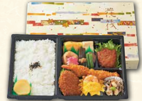
13 行楽弁当 (17.8×27cm) 1,200円 (税抜) 1,296円(税込)