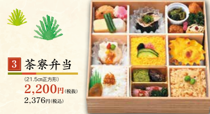
3 茶寮弁当 (21.5cm正方形) 2,200円 (税抜) 2,376円(税込)