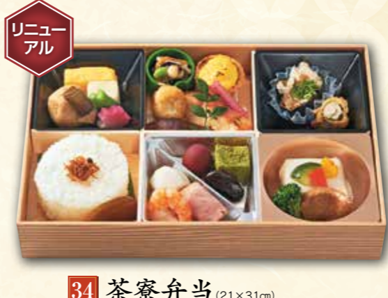
34 茶寮弁当 (21×31cm) 2,800円 (税抜) 3,024円(税込)