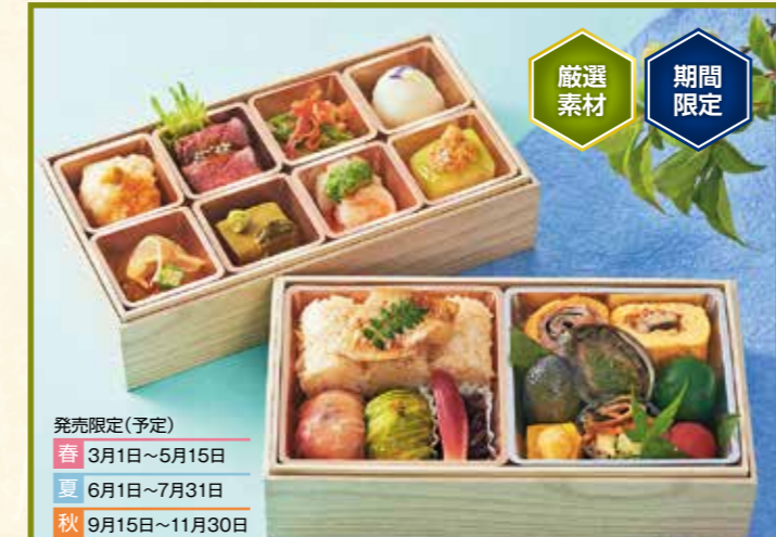
79 茶寮弁当「匠」 (11.5×22.5cm×2段) 5,000円 (税抜) 5,400円(税込) ※季節によって容器・メニューが変わりますのでホームページまたはお問い合わせでご確認ください。