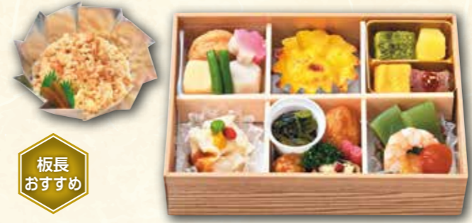
5 茶寮弁当 (ごはん別) (15×21.5cm) 1,700円 (税抜) 1,836円(税込)