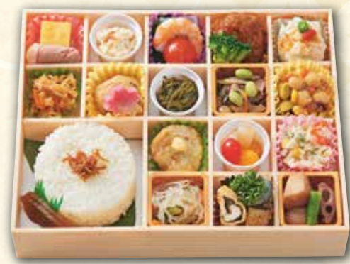
73 このみ弁当 (19.5×25cm) 2,100円 (税抜) 2,268円(税込)