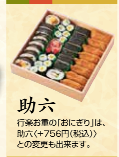
49 行楽お重 (3~4人前) (24cm正方形×2段) 6,600円 (税抜) 7,128円(税込)