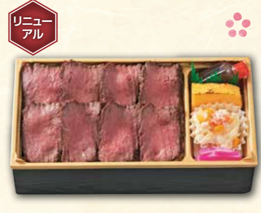
82 嘉穂牛ローストビーフ弁当 (11.6×21.7cm) 2,000円 (税抜) 2,160円(税込)