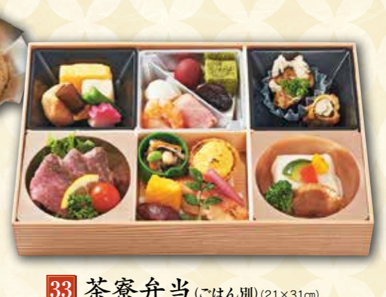
33 茶寮弁当 (ごはん別) (21×31cm) 3,300円 (税抜) 3,564円(税込)