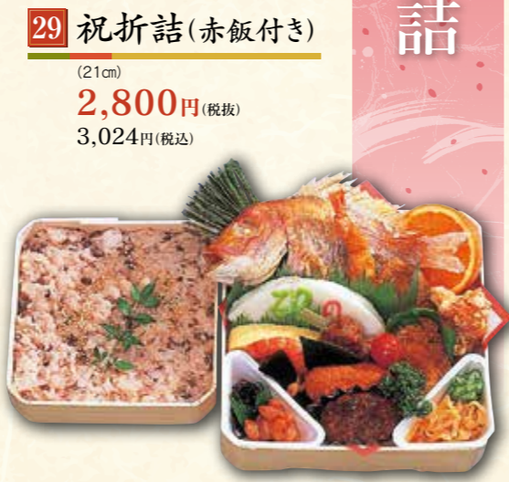
29 祝折詰 (赤飯付き) (21cm) 2,800円 (税抜) 3,024円(税込)

入替 出来ます お弁当のごはんは+162円(税込)で ちらし寿司・助六・ちりめんご飯・ 赤飯との変更も出来ます。 ※対象商品: お弁当・会席類