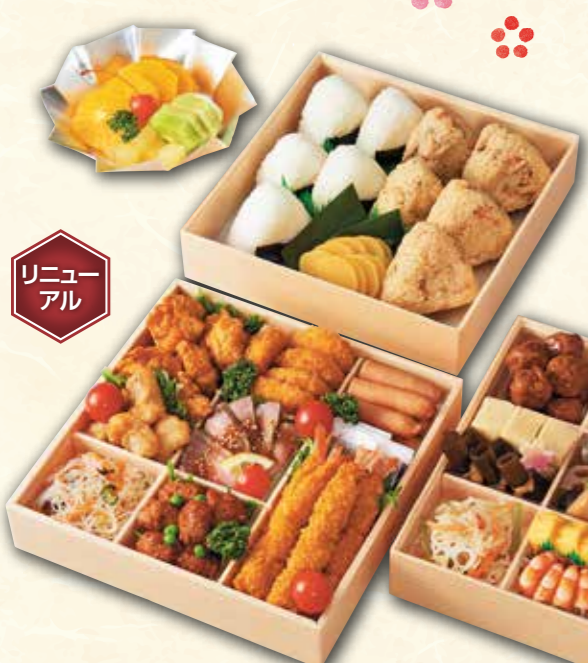
48 行楽お重 (5~6人前) (24cm正方形×3段) 11,000円 (税抜) 11,880円(税込)